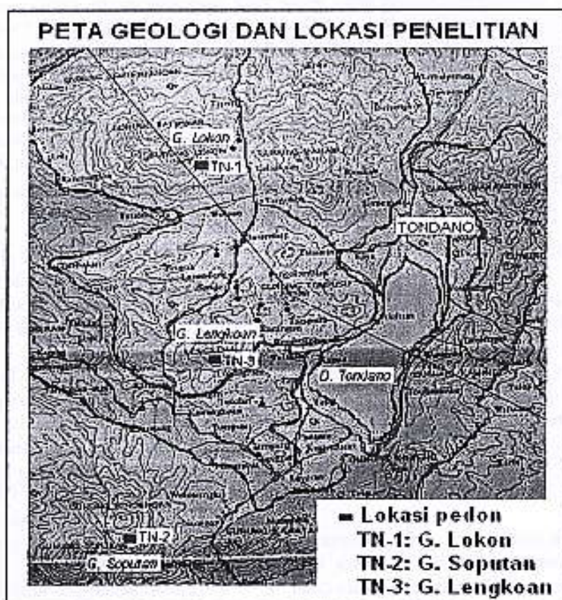
Gambar 1. Peta geologi dan lokasi penelitian.

Menurut peta geologi Manado (Effendi, 1976), daerah penelitian termasuk formasi gunung api muda yang masih aktif, antara lain G. Soputan, G. Lengkoan, G. Lokon dan G. Mahawu (Gambar 1). Susunan bahan erupsi volkan tersebut terdiri atas abu, tuf, lava, dan lapili dengan sifat bahan andesitik sampai basaltik.